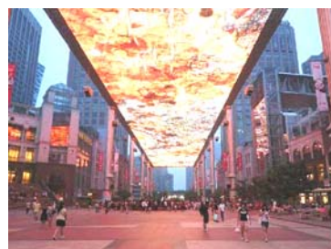
X:\3_Tours\สงกรานต์ 2555\ปักกิ่ง เทียนสิน 5 วัน .doc